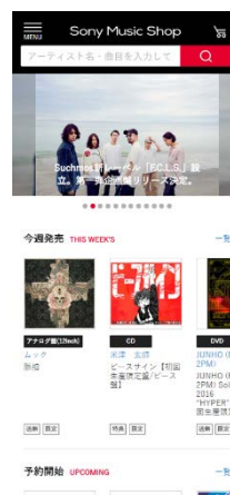
(スマートフォン版)