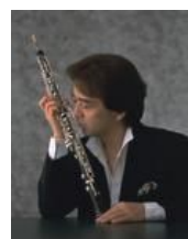
宮本文昭(オーボエ)