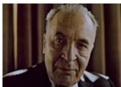
ブルーノ・ワルター(指揮)