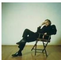
グレン・グールド(ピアノ)