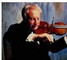
アイザック・スターン(ヴァイオリン)