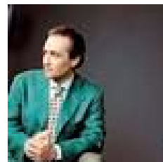
ホセ・カレーラス(テノール)