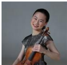
五嶋みどり(ヴァイオリン)