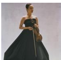
前橋汀子(ヴァイオリン)