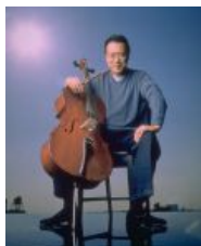
ヨーヨー・マ(チェロ)