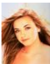
シャルロット・チャーチ(ヴォーカル)