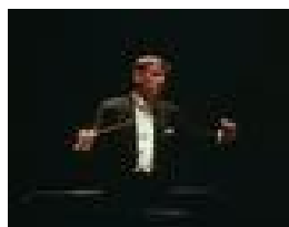
レナード・バーンスタイン(指揮)