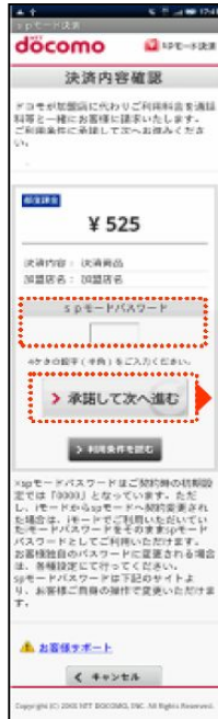
(spモードパスワード入力)