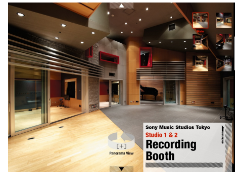
パノラマをぐるぐる回し観たい場所を表示