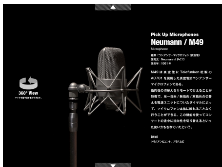
レアなマイクも指で回して鑑賞