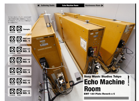
プレートリバーブの聴き比べ