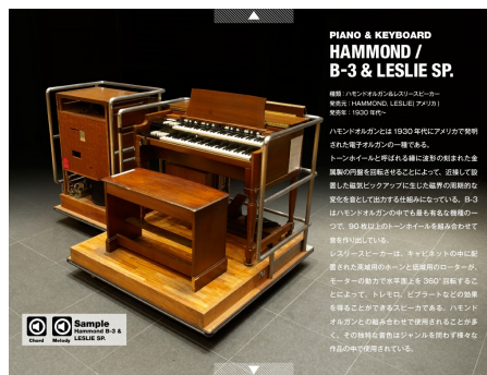
貴重な楽器の音も収録