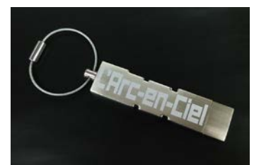
L' Arc~en~Ciel Original USBメモリ