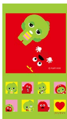
ガチャピン・ムック