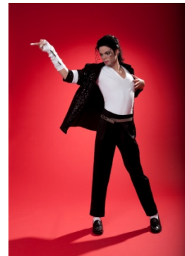
マイケル・ジャクソン等身大フィギュア