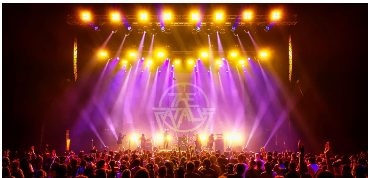
ソフトオープンライブの様相（2022年5月28日（土））