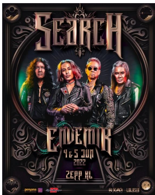
グランドオープニング公演 SEARCH 公演ポスター