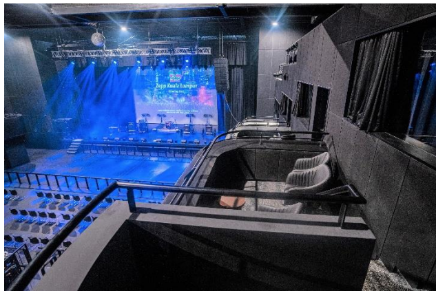
バルコニーシート