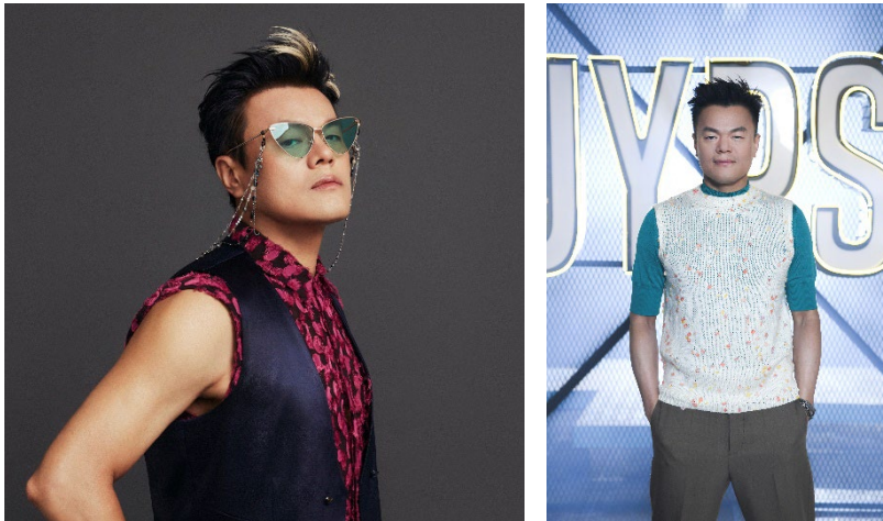
「Nizi Project Season 2」総合プロデューサー J.Y. Park 氏

“AMBASSADOR OF K-POP” - The New York Times