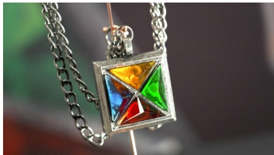
プロジェクトの象徴となる「Nizi ペンダント&キューブ」。ミッション・クリア時オーディション参加者に贈られる。